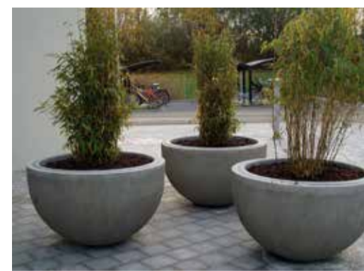
Planteringskärl som farthinder

Utrustning såsom sittmöbler, planteringskärl, belysningsstolpar och cykelställ har samma formspråk färg som cirklarna i markbeläggningen.