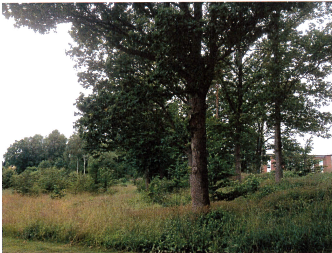
Vegetationsparti vid Trumman.