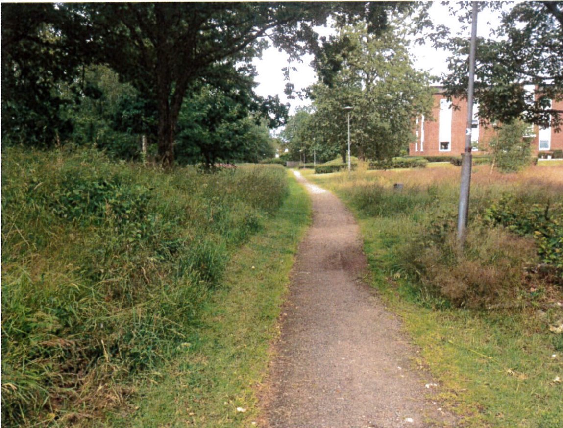
Från området mot väster.