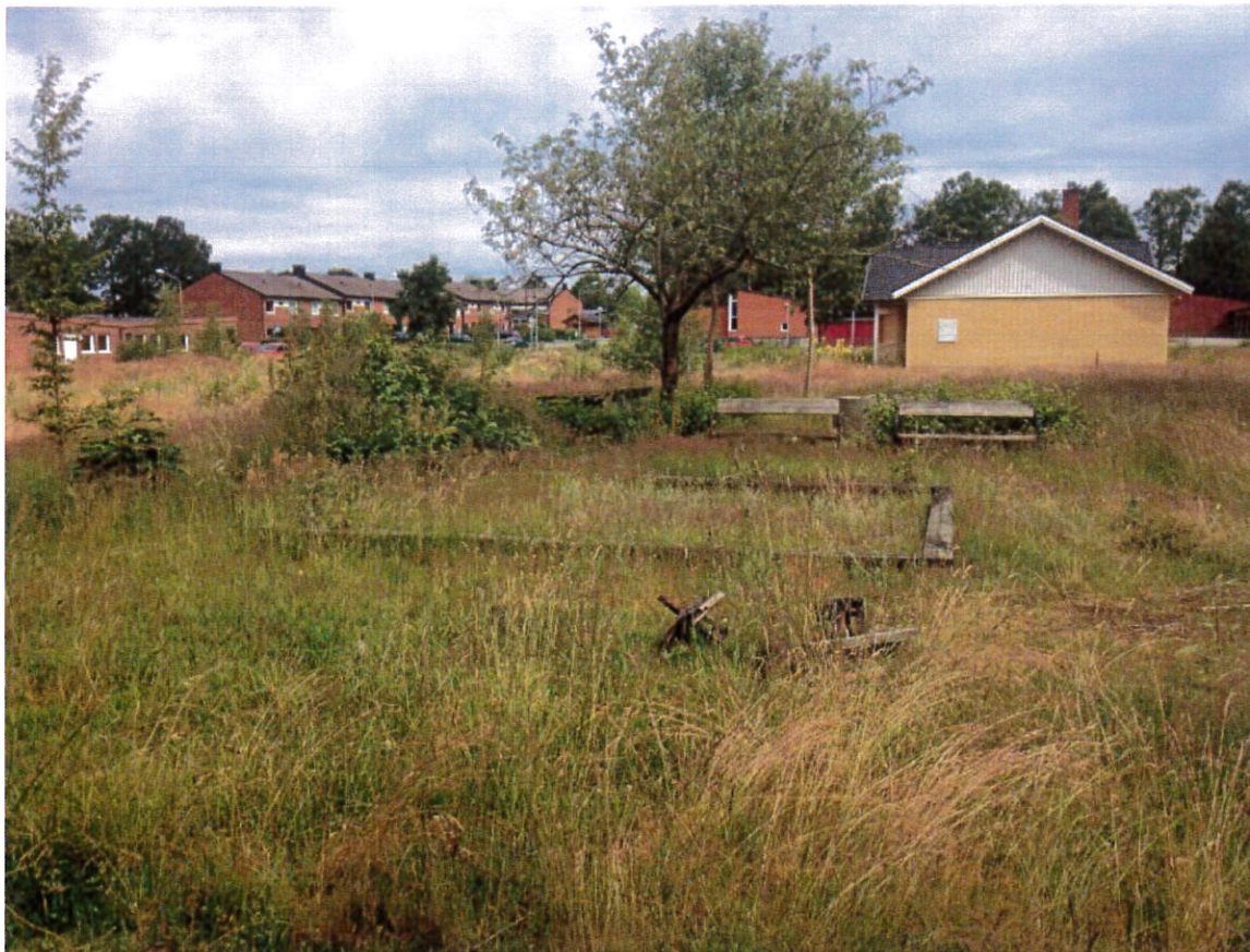
Ej färdigställd villa inom planområdet.