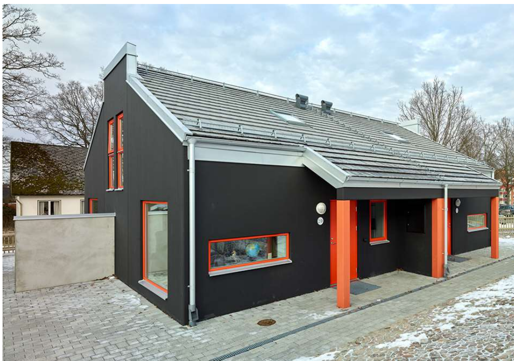
Perstorp1 – Koncepthuset med fyra kompakta lägenheter (Sweco Architects)

ta igen. Priset på äganderätter och bostadsrätter är låga i förhållande till regionen, men har ökat den senaste tiden.