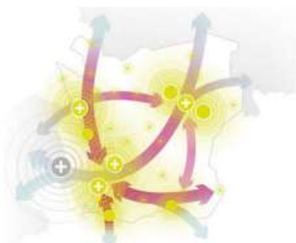
Strukturbild för Skåne (Region Skåne)

Perstorp ingår även i samarbetet Familjen Helsingborg där 11 kommuner samverkar kring utvecklingsfrågor. Inom ramen för samarbetet har en utvecklingsplan tagits fram för 2020-2023 som tar sikte på 2035 samt även en strukturplan för den fysiska utvecklingen. Familjen Helsingborg har fastlagt en vision. År 2035 ska Familjen Helsingborg upplevas som en mångsidig och sammanhängande stadsbygd, uppfattas som innovativ och spännande, uppnå livskvalitet för invånare och livskraft för företagare.