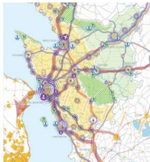
Strukturplan för Skåne Nordväst