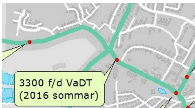
Mätpunkter. Ur förslag till hastighetsplan, 2019.

Trafikmätningar gjordes under sommaren 2016 i en punkt på Oderljungavägen, strax väster om planområdet. Punkten mätte genomsnittlig vardagsdygnstrafik, VaDT. Mätningen visade en trafikmängd om 3300 f/d VaDT, sommaren 2016. Med en prognostiserad ökning med 1,4 % per år resulterar detta i ca 4606 f/d VaDT år 2040.