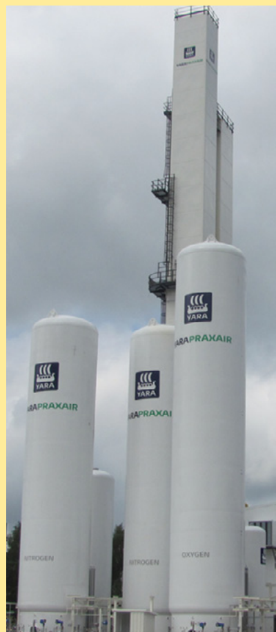
Yara Praxairs nya luftgasfabrik i Perstorp

begränsas till industriparken. Syre underhåller och påskyndar förbränning av brännbara material och risk kan således föreligga vid förhöjda syrehalter i kombination med brännbart material och gnistbildning. Extremt höga krav på renhet finns dock inom luftgasfabriken och närvaron av brännbara material är minimal. Ett flertal processtekniska åtgärder och säkerhetsventiler förhindrar skador från övertryck. All utrustning i fabriken som kommer i kontakt med låga temperaturer är tillverkad i härför anpassade material. Detaljerade riskanalyser har genomförts och lämpliga åtgärder vidtagits för att förebygga risker för omgivningen. I och med hanteringen av syrgas, så tillhör luftgasfabriken den högre kravnivån inom lagstiftningen om allvarliga kemikalieolyckor.