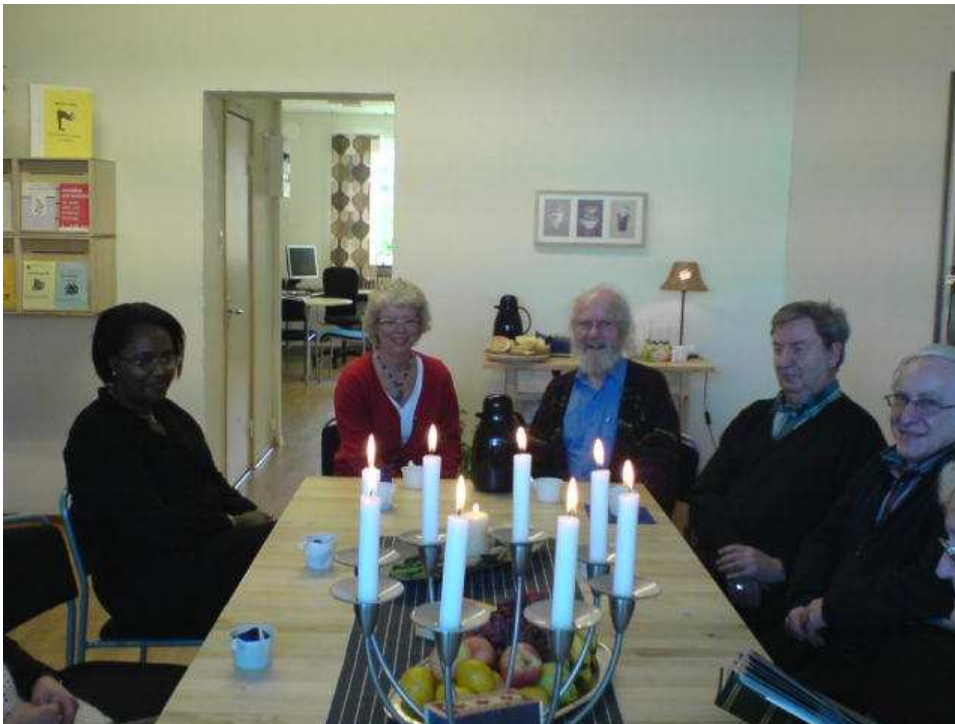
Bild: Från invigningen den 12 mars 2007 av Anhörigcentrum efter flyttningen till Torggatan.

Här kan du koppla av en stund i härlig gemenskap och trivsel. Varje gång har vi ett tema som vi kan diskutera kring. Program finns i skyltfönstret på Anhörigcentrum