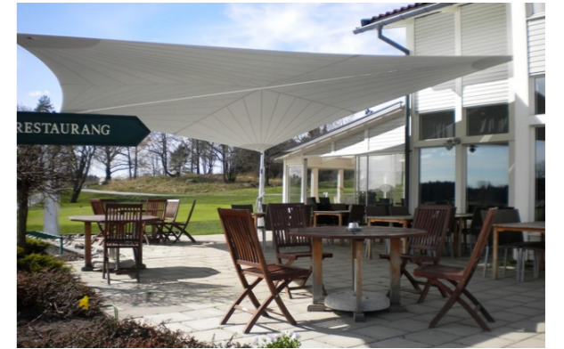
Exempel på segeltak.