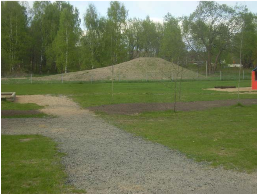
Foto 1. Planområdet

Planprocessen föreslås göras med normalt planförfarande då detaljplanen föreslås överföra allmän platsmark till kvartersmark och förskoleverksamhet och i högsta grad berör allmänheten. Planen strider inte mot gällande ÖP.