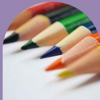
Tre pennor utmaning