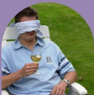
Smakutmaning med ögonbindel

Jag har hittat några populära och roliga utmaningar på "Youtube" som jag tänkte att vi skulle prova ikväll. Ni kommer att delas in i 3 grupper för att sedan utföra dessa utmaningarna. Det blir kaffe och kaka till fika