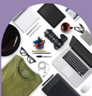
Vad fattas utmaning